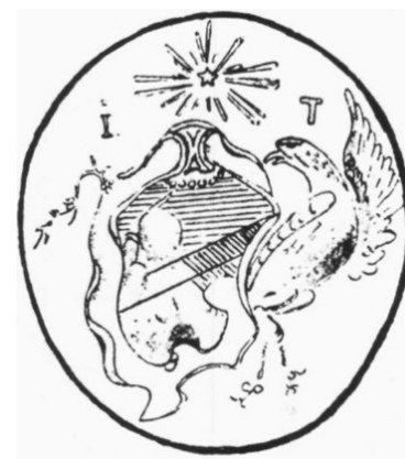
Johan Törnstens sigill

Vi påminner om att betala in årsavgiften, 100 kr per medlem. Pg 39 30 09-6 eller Swish: 123 094 13 02