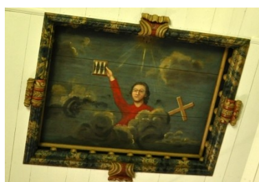
En plafondmålning över koret i Mattmars kyrka målad av Anders Berglin