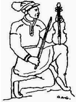
Illustration på Lapp-Nilsmedaljen