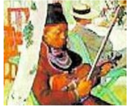
Lapp-Jo (från Carl Larssons målning "Frukost i det gröna")